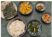
小分けに盛って視覚的なボリューム感をアップ!

には出張時も献立の食事を持参し、どうしても無理なときは次の食事から献立に戻ります。献立を繰り返す理由の一つは、健康的な食量やペースがつかめるようになること。決まった時間に空腹になり、外食などにも興味がなくなります。今回も4週間を