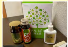
荘水、がんばれ善玉菌、GGなどをいつもリュックに

りか不安でしたが、キャベツを多めに食べたりよく噛んだりして量の問題はなくなりました。今はメニュー表で1週間全体をイメージしながら、1カ月後を楽しみにスタートします。基本的