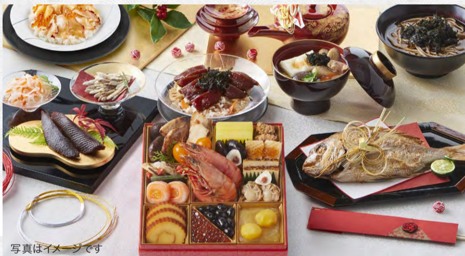
写真はイメージです 【セット内容】★和の重、国産天然真鯛の姿焼き、自家製粉そば粉のなま蕎麦、杵つき餅、鶏とマッシュルームのマカロニグラタン、旨味まぐろの醤油漬、北海の恵みごちそう丼、お雑煮の素など ★：リニューアルしたお品です

今年も美味づくしの和の重、年越しに食べたい蕎麦やお正月の食卓に欠かせない杵つき餅や田作りなども入ったお得なセット。年末年始の食の楽しみをしっかりと味わいながらSONOKO式献立をきちんと実行したい方におすすめします。 定価 31,000円 ▼ 10月限定特価 27,900円 (税込 30,132円 ) 超早割 10%OFF 3,100円 お得!