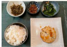
献立で初めて食べた餡かけしんじょう、美味しかった!

年齢を感じさせない努力を日々重ねています。4週間献立を実行していないとつい食べすぎてしまうので、何となくカラダが…と感じてきたら献立で食生活をリセット。初回の挑戦時は量が足