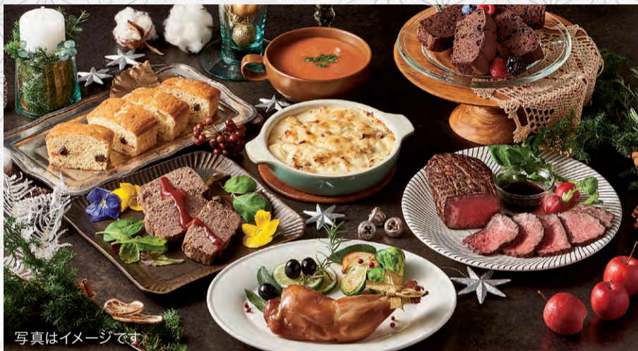
写真はイメージです 【セット内容】大山どりのローストチキン 黒毛和牛ローストビーフ、海の幸マカロニグラタン 国産牛100%プレミアムミートローフ、北陸甘エビのビスクスープ 旨味まぐろの醤油漬、濃厚ガトーショコラなど

大好評の大山どりのローストチキンをはじめ、黒毛和牛ローストビーフや国産牛100%プレミアムミートローフなどの人気メニューがずらり。お楽しみスイーツは濃厚ガトーショコラとそのこの野菜菓子をご用意しました。 定価 23,000円 ▼ 10月限定特価 20,700円 (税込 22,356円 ) 超早割 10%OFF 2,300円 お得!