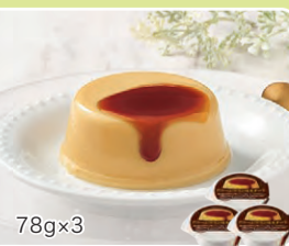
E ドリームプリン カスタード 3個 78g×3