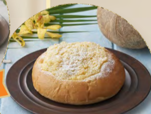
New! 極みココナッツパン