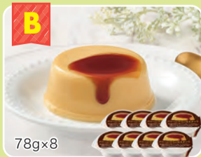
B ドリームプリン カスタード 8個 78g×8