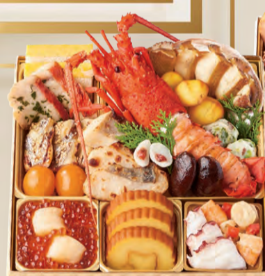
先行予約がお得! SONOKOのおせち2024