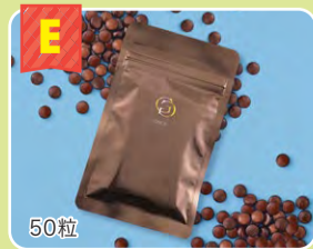
SONOKO GG 50粒入 1袋 50粒