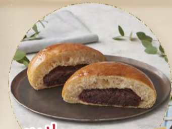
New! 極み特大粒あんぱん