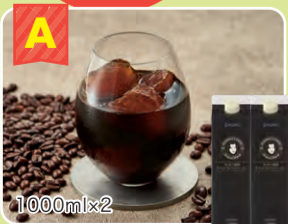
A その子珈琲 アイスブレンドコーヒー 2本 1000ml×2