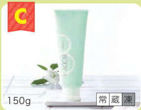
C ボディジェル 1本 150g 常蔵凍