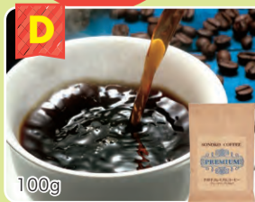
D プレミアムコーヒー ブルーマウンテンNo.1 1袋 100g