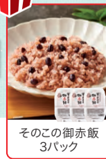
そのこの御赤飯 3パック

※セール品・プレゼント品は十分ご用意いたしておりますが、万一お品切れの際はご容赦ください ※写真はイメージです