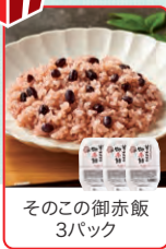
そのこの御赤飯 3パック