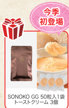
SONOKO GG 50粒入1袋 トーストクリーム 3個