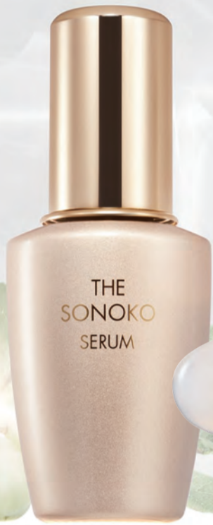
THE SONOKO SERUM