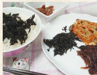
和総菜、副菜の種類も豊富。

昨年来SONOKO草創期の製品が復刻し、SONOKOが新たなスタートを切ったことなどを機に、自分ももう一度原点に戻って献立実行しなくてはと思いました。30数年ぶりのチャレンジに、きちんと