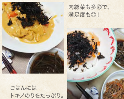
肉総菜も多彩で、 満足度も◎!