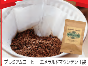
プレミアムコーヒー エメラルドマウンテン1袋