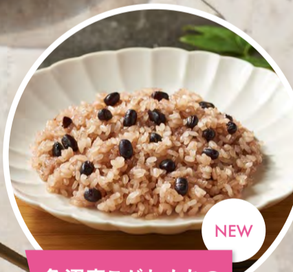
NEW 魚沼産こがねもちの 御赤飯登場

ザ・ソノコセラム & WB グランクリームで 年齢肌の悩みを跳ね返し 揺るぎない肌へ