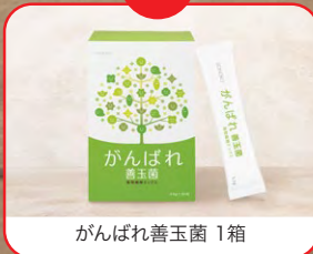
がんばれ善玉菌 1箱